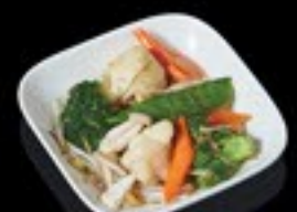
62 Tjap Tjoi seizoensgroenten