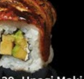
39 Unagi Maki paling, omelet roomkaas, avocado