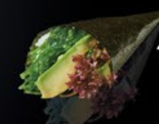
42 Veggie zeewier, mayo