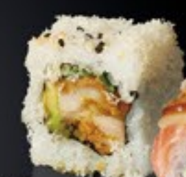
37 Kip Roll gefr. kip, avocado komkommer