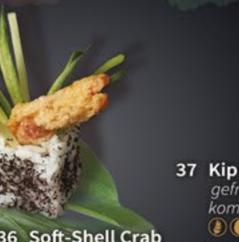
36 Soft-Shell Crab soft-shell krab, komkommer, mayo (3 pcs.) + € 3,80