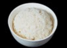
68 Gohan witte rijst