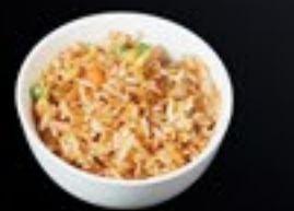
69 Yaki Meshi gebakken rijst