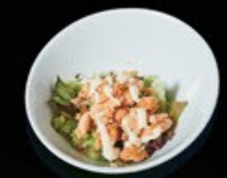
47 Grilled Salmon gegrilde zalm