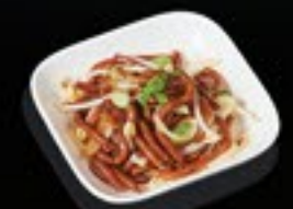
74 Yaki Udon Japanse dikke bami