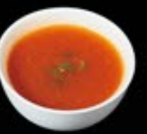
72 Tomato Soup tomatensoep