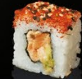
27 Shichimi Roll gegr. zalm, Japanse peper