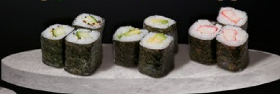
24 Kani krabstick