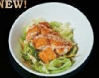
46 Fish Salad gefrituurde vis