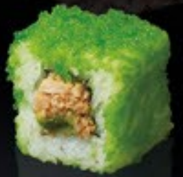
32 Spicy Tuna Roll gegr. tonijn, avocado