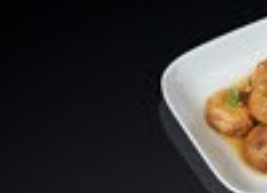
60 Kinoko champignons