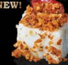
34 Spicy Chicken Roll gefr. kip, rucola, avocado, rode peper