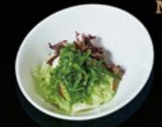
45 Seaweed zeewier