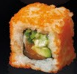
31 California Salmon zalm, avocado, mayo, komkommer