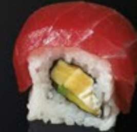
26 Tuna Roll tonijn, roomkaas, omelet