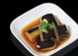
59 Age Nusu aubergine