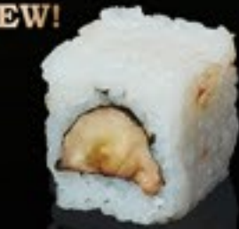
28 Banana Roll banaan & chocolate saus