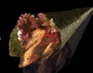
43 Unagi paling