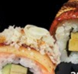
38 Mount Fuji Roll tempura, ei, zalm, roomkaas, avocado