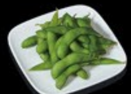
58 Edamame sojabonen