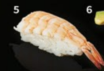
9 Tuna Truffle gefl. tonijn met truffel