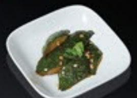
61 Zucchini courgette