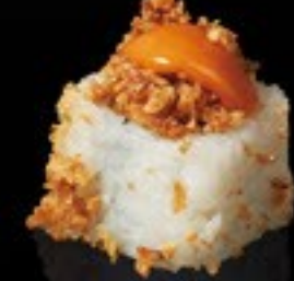
33 Crunchy Roll gamalenkroket komkommer