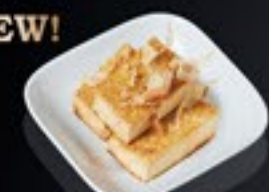
63 Fried Tofu gefr. tofu & bonito