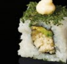
29 Crispy Mayo tempura, mayo, avocado