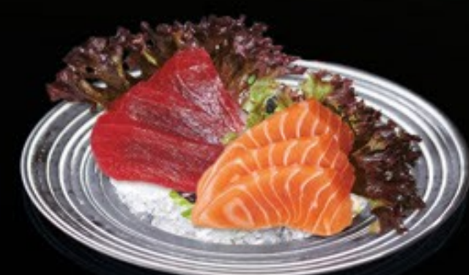
51 Tuna Sashimi tonijn sashimi (5 pcs.) + € 3,50