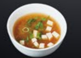
70 Miso Soup sojabonensoep