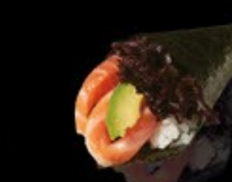
44 Salmon zalm, mayo