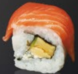
25 Salmon Roll zalm, roomkaas, omelet