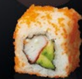
30 California Roll surimi, avocado, mayo