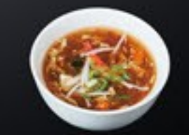
71 Peking Soup pikante soep