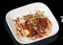
73 Yaki Noodles gebakken bami